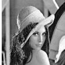
Gambar 1 Citra lena.bmp

Semua tabel dan gambar yang anda masukkan dalam dokumen harus disesuaikan dengan urutan 1 kolom atau ukuran penuh satu kertas, agar memudahkan bagi reviewer untuk mencermati makna gambar.